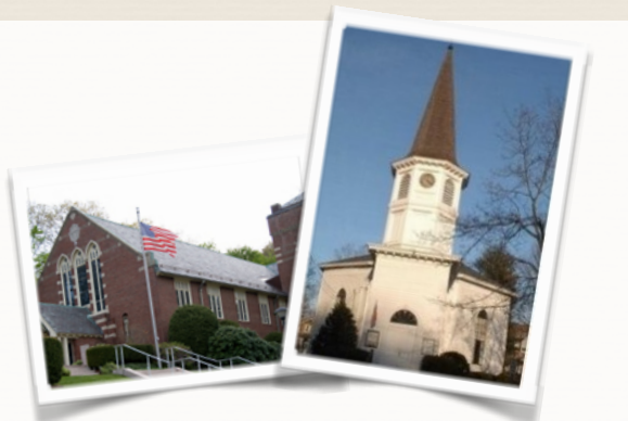
Sacred Heart Parish 21 Follen Road